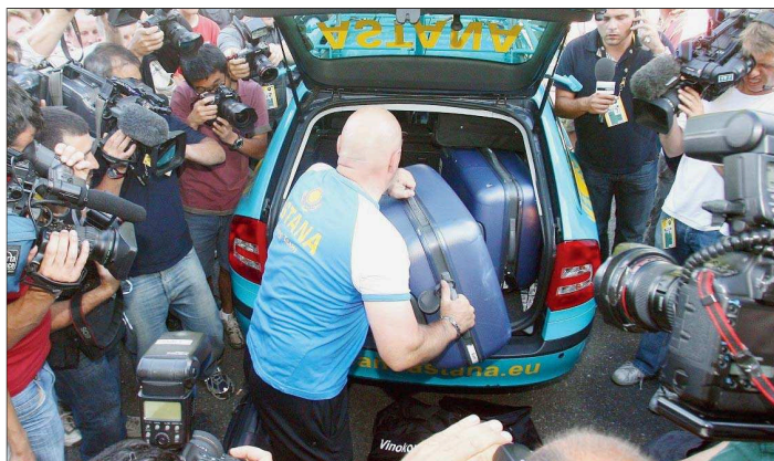
LICENCE Malgré tous les problèmes rencontrés cette année (ici au Tour de France), l'équipe Astana a de nouveau été admise dans le ProTour.