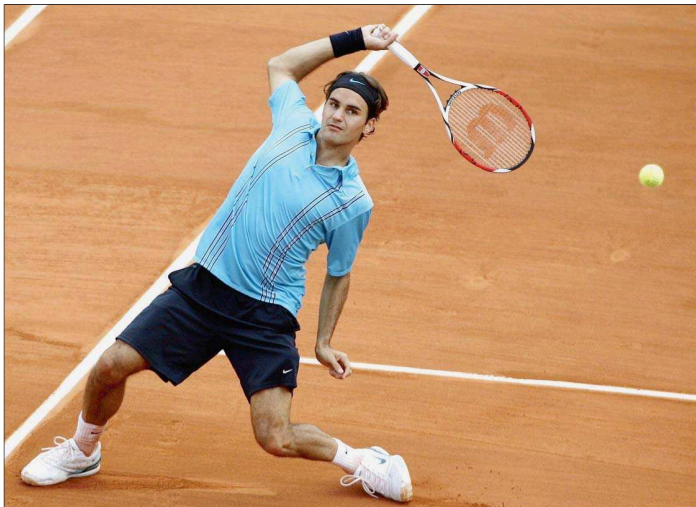
FATIGUÉ Roger Federer s'est beaucoup dépensé ces 15 derniers jours à Roland-Garros. Et pour aborder la défense de ses quatre titres à Wimbledon, il a préféré renoncer au gazon de Halle.

Comme il ne joue plus jamais en compétition la semaine précédente un tournoi du Grand Chelem, Roger Federer remettra son titre en jeu à Wimbledon le lundi 25 juin sans avoir disputé un seul match officiel sur gazon. Cette année, il avait également abordé l'Open d'Australie sans grand repère après son impasse sur le tournoi de Doha. Son manque de compétition ne l'avait pas empêché de gagner à Melbourne sans